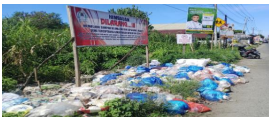
Gambar 2. Keadaan Sampah di Jalan Kesehatan Pada Bulan Juli 2024 (Sebelum dilakukan pembersihan).

Jalan Kesehatan terletak Gampong Drien Rampak Kecamatan Johan Pahlawan Kabupaten Aceh Barat. Jalan berada di tengah-tengah kota Meulaboh, di jalan ini terdapat perumahan Dinas Kesehatan Kabupaten Aceh Barat. Namun lokasi tersebut dijadikan tempat pembuangan sampah oleh masyarakat seperti pada gambar berikut: