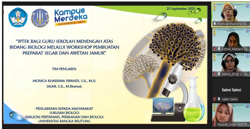
Gambar 1. Materi PPT oleh Narasumber