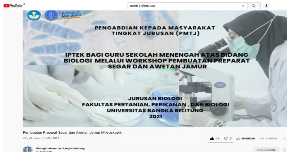
Gambar 2. Video Pembelajaran tentang Pembuatan Preparat Segar dan Awetan Jamur