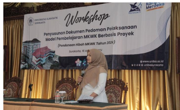
Gambar 5. Pelaksanaan Workshop I Penyamaan Persepsi Dokumen