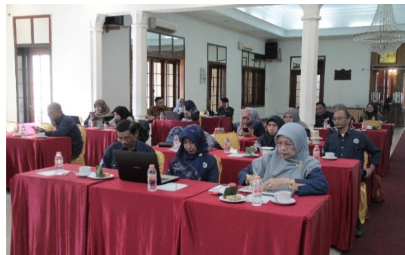
Gambar 4 . Kegiatan Penyusunan Pedoman Pelaksanaan MKWK