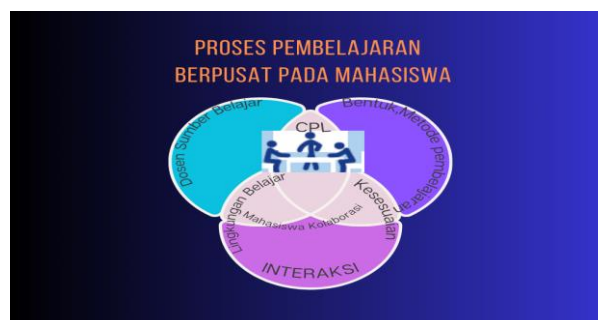
Gambar 2. Tahap Pelaksanaan Pembelajaran

Mempersiapkan ruang kelas atau lingkungan pembelajaran yang mendukung kolaborasi, kreativitas, dan eksplorasi.