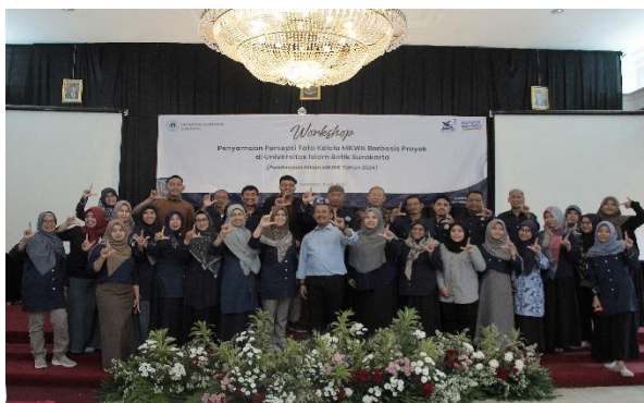
Gambar 6. Pelaksanaan Rapat dan workshop II Penyusunan Dokumen.