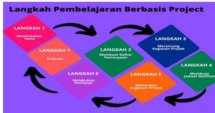
Gambar 3 . Langkah-Langkah Pembelajaran Berbasis Project

Menumbuhkan kesadaran kritis terhadap isu-isu sosial dan hukum di masyarakat. Laporan proyek digunakan oleh dosen sebagai studi kasus di kelas lain.