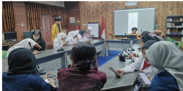
Gambar 4. Sesi Praktik

dijelaskan secara rinci. Teknik pengisian setiap bagian CV juga dibahas, dengan penekanan pada cara menonjolkan keunggulan personal dan skill yang menjadi nilai jual utama. Tujuan sesi ini adalah agar siswa mampu menghasilkan CV yang tidak hanya informatif tetapi juga menunjukkan potensi diri sebagai sumber daya manusia berkualitas yang siap memasuki dunia kerja. Pada sesi kedua (praktik), seluruh peserta (20 siswa SMKN 5 Samarinda) melakukan praktik pembuatan CV secara langsung menggunakan website CVCEPAT melalui smartphone masing-masing. Pendekatan Learning by doing diterapkan agar siswa dapat secara langsung mengaplikasikan materi yang telah disampaikan pada sesi edukasi.