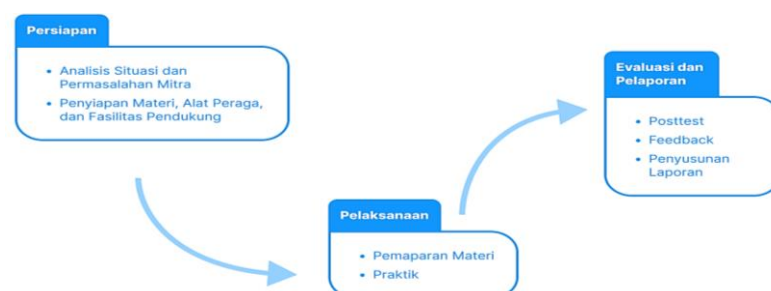
Gambar 1. Metode Pelaksanaan

Pelaksanaan kegiatan dibagi menjadi tiga tahapan utama, sebagaimana diilustrasikan pada Gambar 1.