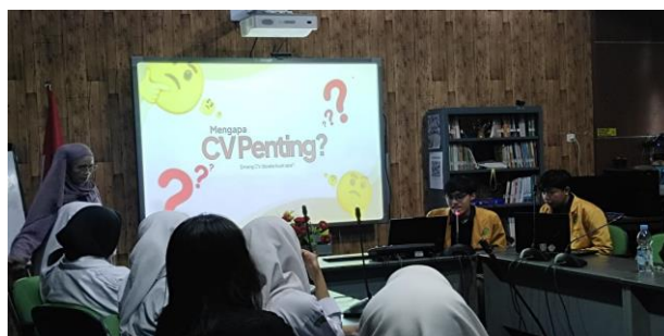
Gambar 3. Sesi Edukasi

Kegiatan sosialisasi dan pelatihan pembuatan CV ini terdiri dari tiga sesi utama, yaitu edukasi, praktik, dan evaluasi. Pada sesi pertama (edukasi), tim pengabdian (selanjutnya disebut instruktur) menyampaikan materi mengenai urgensi CV sebagai representasi kualitas dan kompetensi individu di hadapan HRD. Penyampaian materi dilakukan secara interaktif, menekankan aspek teoritis dan elemen-elemen penting yang harus ada dalam CV agar menarik dan kompetitif dalam proses rekrutmen (Gambar 3).