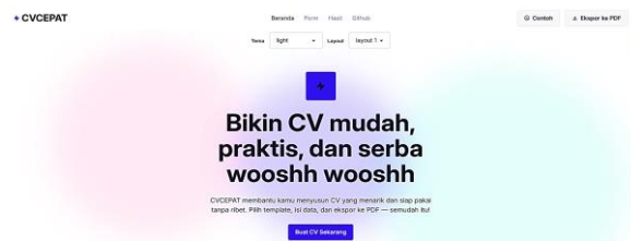
Gambar 2. Website CVCEPAT

Tim menyiapkan materi presentasi (PPT) yang mencakup pengertian, komponen CV, dan panduan penggunaan website CVCEPAT. CVCEPAT (tampilan pada Gambar 2) dirancang untuk membantu peserta menyusun CV yang menarik dan sesuai standar secara mudah dan efisien.