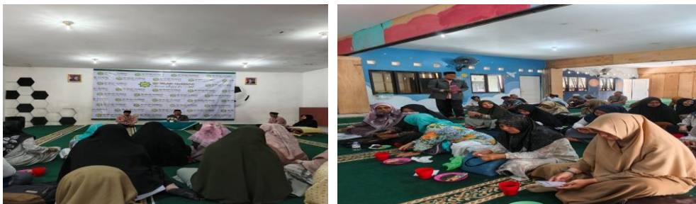
Gambar 1. Pembukaan Pelatihan Dan Sesi Tanya Jawab Dengan Peserta

Kegiatan pengabdian kepada masyarakat dilaksanakan di SD Al Izzah Purwokerto, Kecamatan Karangsalam Kidul, Kabupaten Banyumas pada tanggal 6-7 Juni 2025 berjalan dengan baik dan lancar serta memperoleh dan menambah pengetahuan bagi peserta.