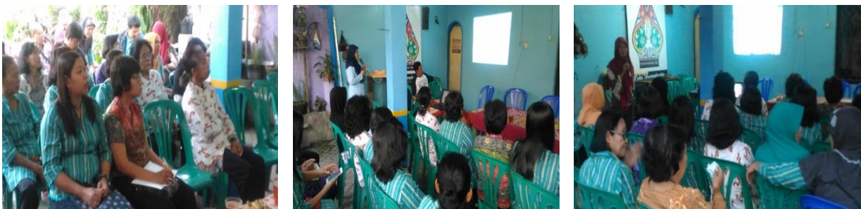
Gambar 2. Dokumentasi Kegiatan Penyuluhan

Dengan terbentuknya bank sampah dapat mengurangi jumlah sampah rumah tangga yang dibuang ke TPA, karena melalui Bank Sampah dapat digunakan sebagai alat untuk mengedukasi warga masyarakat terkait pengelolaan dan pemilahan sampah rumah tangga, yang pada akhirnya dapat memberi manfaat secara ekonomi bagi warga. Agar warga masyarakat dapat secara berkelanjutan dalam mengelola sampah rumah tangga supaya kualitas lingkungan tetap terjaga, maka dapat dikenalkan konsep 3R ( reduce, reuse, recycle ). Jadi implementasi prinsip 4R dalam pengelolaan bank sampah, dapat memberikan manfaat ekonomi bagi masyarakat dan juga mewujudkan lingkungan hidup yang baik dan sehat. Kegiatan penyuluhan tentang pengelolaan sampah rumah tangga dan bank sampah seperti tergambar di Gambar 2 di bawah ini.