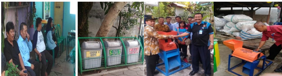
Gambar 3. Pelatihan dan Penyerahan Mesin Pencacah Sampah