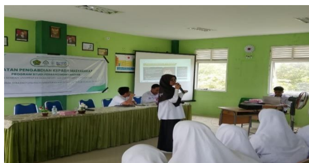
Gambar 3. Penyampaian materi dengan judul ayo menjadi pelajar yang moderat

Hasil pre-test memberikan gambaran awal bahwa sebagian siswa telah memahami beberapa konsep moderasi beragama, namun belum menguasai konteks penerapan nilai-nilai tersebut dalam kehidupan sehari-hari. Hal ini tampak dari variasi jawaban yang diberikan, terutama terkait kemampuan membedakan antara sikap moderat, ekstrem, maupun permisif. Rata-rata nilai pre-test berada pada angka 86,61, menunjukkan bahwa siswa sudah memiliki kapasitas dasar yang baik, namun tetap membutuhkan penguatan materi.