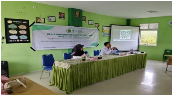
Gambar 1. Pelaksanaan pre-test tentang pemahaman moderasi beragama

moderat. Post-test ini diberikan setelah seluruh materi selesai dipaparkan, dengan tujuan mengetahui peningkatan pengetahuan, perubahan cara pandang, serta kemampuan peserta dalam menerapkan konsep moderasi beragama dalam kehidupan sehari-hari.