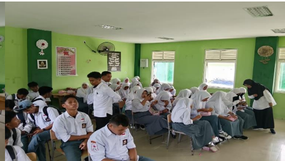
Gambar 2. Peserta mengerjakan pre-test

Sebelum Masuk pada materi, dilakukan evaluasi awal ( pre-test ) untuk mengukur tingkat pemahaman peserta mengenai konsep moderasi beragama. Pre-test penting dilakukan untuk memperoleh gambaran awal mengenai tingkat pemahaman peserta sebelum pelatihan dimulai, sehingga penyelenggara dapat menyesuaikan materi dan metode pembelajaran sesuai kebutuhan nyata. Hasil pre-test juga berfungsi sebagai tolok ukur awal untuk mengukur efektivitas program pelatihan melalui perbandingan dengan hasil post-test . Selain itu, pre-test membantu mengidentifikasi area atau topik yang masih lemah dan memerlukan penekanan lebih selama pelatihan. Dengan demikian, pelaksanaan pre-test memastikan proses pelatihan menjadi lebih terarah, relevan, dan berdampak optimal bagi peserta (I Made Markus Suma, et, al. 2025).