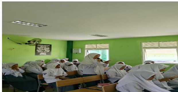
Gambar 4. Peserta menyampaikan pertanyaan pada narasumber

Hal penting lainnya yakni bahwa melalui moderasi beragama siswa diharapkan dapat saling menghargai dan menghormati perbedaan yang ada khususnya antar sesama siswa yang lain, sebelum pada akhirnya nanti terjun langsung ke lingkungan masyarakat (Novi Ulfia, et, al. 2024). Sesi ini diperkaya dengan contoh-contoh aplikatif yang dekat dengan kehidupan peserta, seperti praktik dialog yang sehat, penggunaan media sosial yang bijaksana, serta kemampuan menghargai perbedaan pandangan. Dengan demikian, pemaparan materi tidak hanya bersifat teoritis, tetapi juga memberikan gambaran konkret mengenai bagaimana nilai-nilai moderasi beragama dapat diimplementasikan dalam kehidupan pelajar sehari-hari.