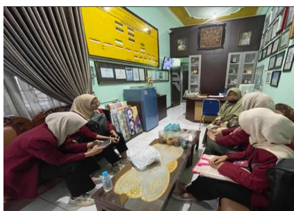
Gambar 3. Koordinasi awal