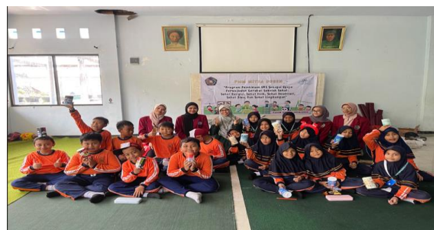
Gambar 6. Penutupan