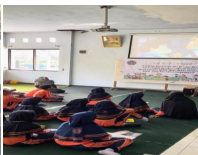
Gambar 4. Penayangan video bullving