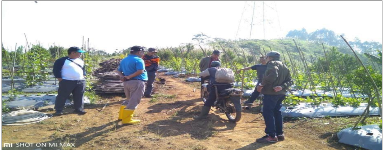
Gambar 2. Desa Sukamekar: Lokasi Reboisasi Lahan Kompensasi IPPKH