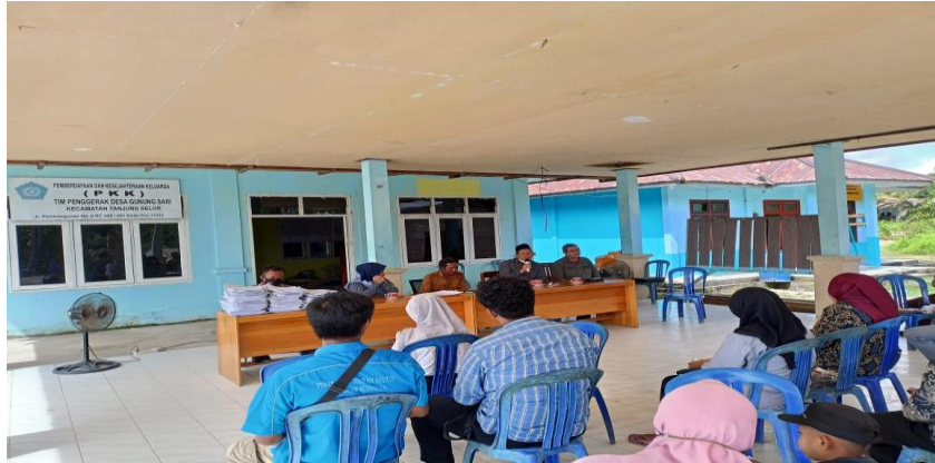
Gambar 9. Pemaparan materi oleh Tim Fasilitator Dosen Unikaltar