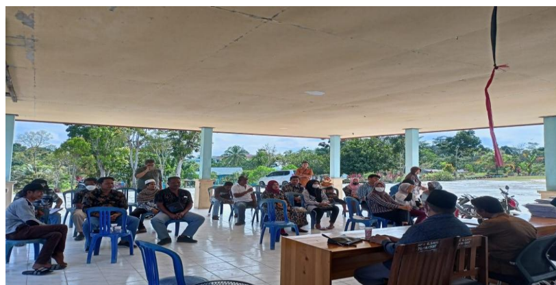
Gambar 8. Peserta hari kedua training Community Organizer SDGs diskusi &Tanya Jawab