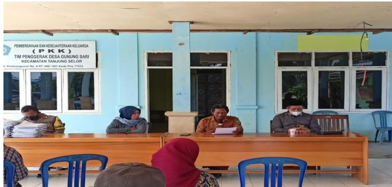
Gambar 7. Hari kedua training Community Organizer SDGs Pemdes Gunung Sari

warganya dalam proses perencanaan dan penganggaran pembangunan desa yang lebih menginternalisasi sasaran dan indikator-indikator SDGs.