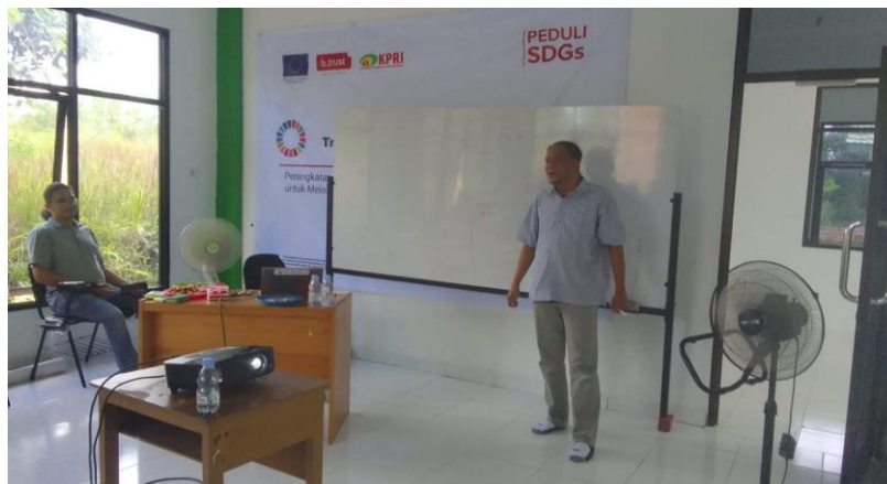
Gambar 4. Pemaparan materi oleh Tim CSO

Merujuk pada strategi pokok tersebut, langkah-langkah yang dilakukan berporos pada dua arah sekaligus, yaitu: proses pendampingan pada pemerintah daerah dan penguatan kapasitas pada organisasi masyarakat sipil. Dengan merujuk pada system desentralisasi di Indonesia, dalam hal pendampingan pada pemerintah daerah ruang lingkupnya terfokus pada pemerintah kabupaten dan pemerintah desa. Selain itu, pemerintah propinsi sebagai perpanjangan tangan pemerintah pusat telah dikenai kewajiban khusus untuk menyusun Rencana Aksi Daerah (RAD) SDGs.