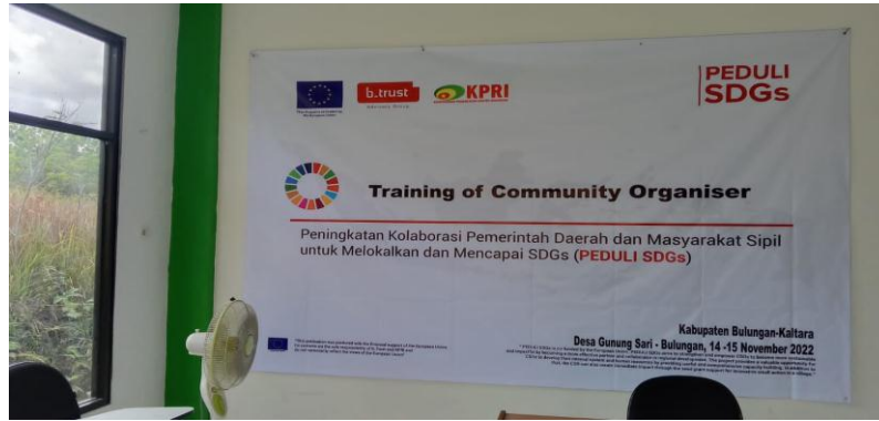
Gambar 3. Spanduk Kegiatan Training Of Community Organizer

Kegiatan yang dilakukan ini merupakan bagian dari program kerja sama antara B_Trust, Konfederasi Pergerakan Rakyat Indonesia (KPRI) dan Komisi Uni Eropa untuk Indonesia dan para dosen dari Universitas Kaltara Tanjung Selor sebagai fasilitator dengan komunitas ponpes fatimah az- zahrah dan Pemerintah Kabupaten Bulungan dalam hal ini Pemerintah Desa Gunung Sari Kecamatan Tanjung Selor.