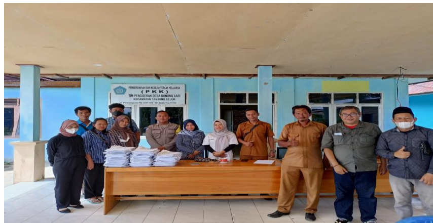
Gambar 10. Foto bersama tim CSO SDGs, Pemdes Gunung Sari & Fasilitator Dosen Unikaltar.