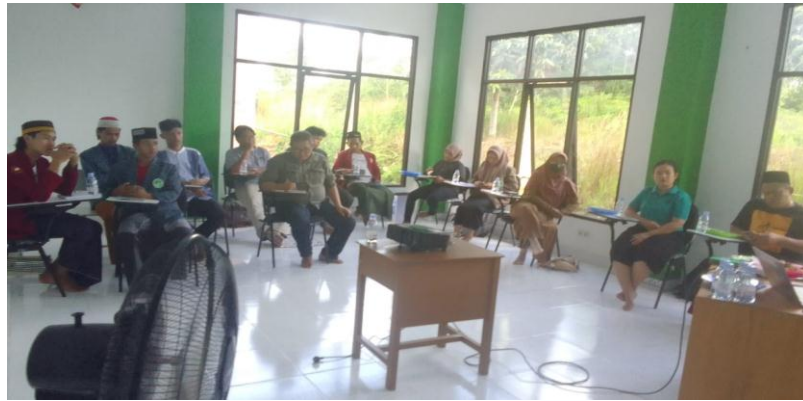
Gambar 5. Peserta training Community Organizer SDGs

Sementara itu, dalam hal penguatan kapasitas organisasi masyarakat sipil, dilakukan sejumlah pendekatan, yaitu: pendampingan teknis, workshop sampai pada pelatihan-pelatihan. untuk penguatan visi, rencana strategis, aspek manajerial sampai pada kapasitas-kapasitas terkait advokasi dan pengorganisasian. Penguatan kapasitas ini fokus pada 30 organisasi masyarakat sipil yang tersebar di 10 kabupaten dan di 5 propinsi. Proses peningkatan kapasitas ini telah berlangsung sejak bulan Maret 2020.