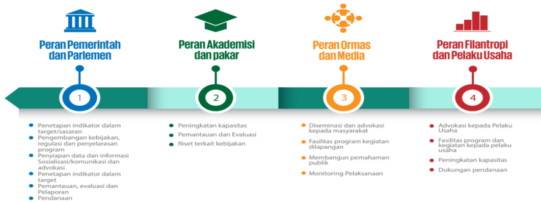
Gambar 1. 4 Platform Partisipasi TPB/SDGs yang terlibat

pelaporannya. Para pemangku kepentingan (stakeholder) utama yang berpartisipasi aktif dalam pelaksanaan dan pencapaian TPB/SDGs di Indonesia terdiri dari empat platform, yakni: Pemerintah dan Parlemen, Akademisi dan Pakar, Organisasi Kemasyarakatan dan Media, Filantropi dan Pelaku Usaha ( www.icctf.or.id/sdgs ).