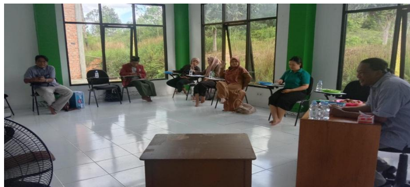
Gambar 6. Dialog & Diskusi peserta training Community Organizer SDGs

Sementara itu, dalam hal penguatan kapasitas organisasi masyarakat sipil, dilakukan sejumlah pendekatan, yaitu: pendampingan teknis, workshop sampai pada pelatihan-pelatihan. untuk penguatan visi, rencana strategis, aspek manajerial sampai pada kapasitas-kapasitas terkait advokasi dan pengorganisasian. Penguatan kapasitas ini fokus pada 30 organisasi masyarakat sipil yang tersebar di 10 kabupaten dan di 5 propinsi. Proses peningkatan kapasitas ini telah berlangsung sejak bulan Maret 2020.