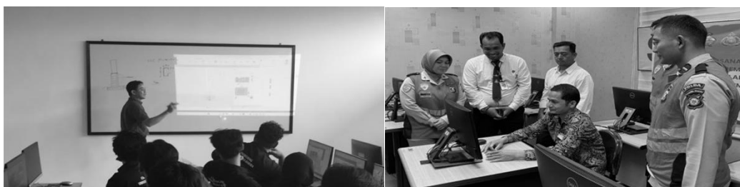
Gambar 3. Proses pemaparan dan audit perangkat TI