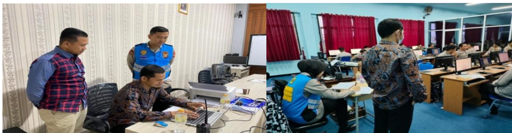
Gambar 2. Proses audit perangkat dan keamanan jaringan