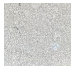
Gambar 1. Droplet Emulsi mayonnaise kontrol (perbesaran 1000x)

rendah dikarenakan meningkatnya fase air pada sistem emulsi. Hal ini sejalan dengan penelitian Prasetya dan Evanuarini (2019), yang menyatakan bahwa peningkatan fase air membuat ukuran globula besar serta terdapat banyak ruang antar droplet. Hal tersebut menyebabkan droplet bergerak tidak teratur karena adanya ruang kosong. Pada perlakuan dengan konsentrasi minyak dan tepung porang yang tinggi, ukuran globula yang dihasilkan kecil, rapat, dan seragam, terutama pada perlakuan kontrol yang dimana menggunakan konsentrasi minyak sebesar 70%.