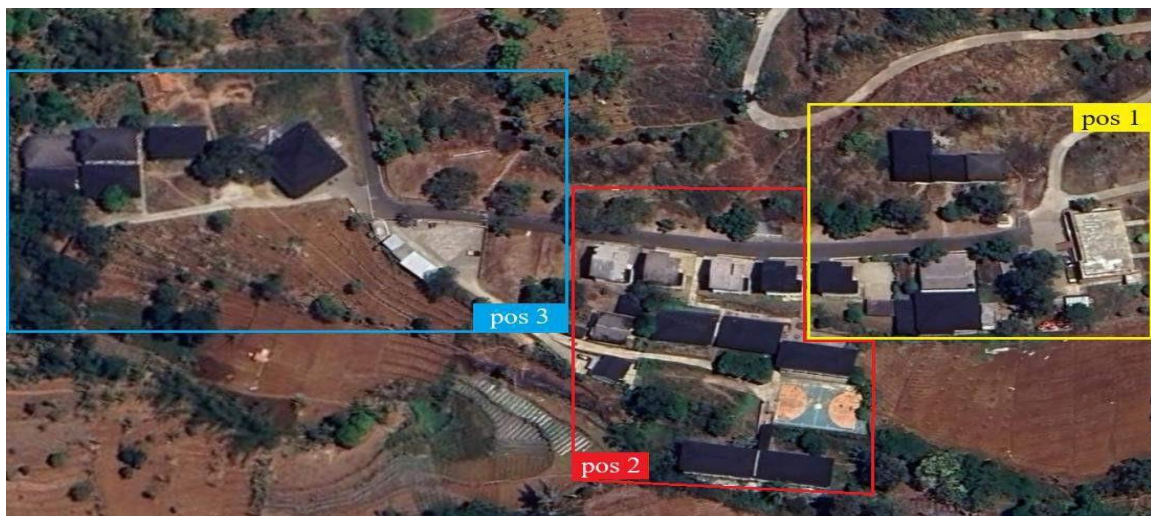
Gambar 1. Denah kawasan Pesantren PQBS beserta cakupan pos pengamatan tonggeret

basket, ruang kelas Baanin dan ruang kelas MA) dan pos 3 (Kafe Bahagia, Kantin Baanin, lapangan parkir, Masjid MPQ 1 dan Asrama Baanin). Tonggeret yang ditemukan ditangkap menggunakan jaring serangga, dimatikan dengan cara menyuntikkan klorofom ke bagian toraksnya kemudian diawetkan secara insektarium. Spesies yang telah diawetkan kemudian dianalisis menggunakan bantuan jurnal yang relevan, aplikasi Inaturalist dan Google Lens. Parameter lingkungan yang dihitung dalam penelitian ini adalah suhu dan kelembaban.