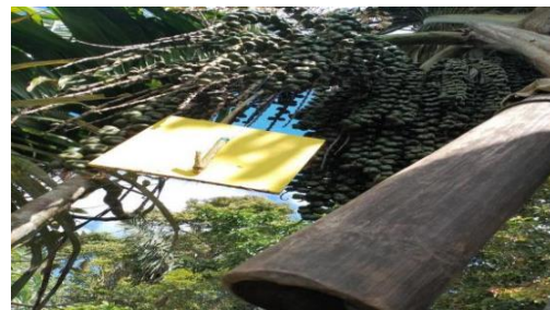
Gambar 2. Perangkap feromon

empat unit. Permukaan tripleks dicat dengan warna sesuai standar atraktan visual, kemudian dilapisi zat atraktan metileugenol (Tarwotjo, et al , 2019). Perangkap dipasang pada posisi sejajar dengan tandan bunga aren agar serangga yang tertarik mendekati sumber aroma. Di bawah perangkap diletakkan wadah plastik transparan berisi air untuk menjebak serangga yang jatuh, sehingga memudahkan pengumpulan dan identifikasi.