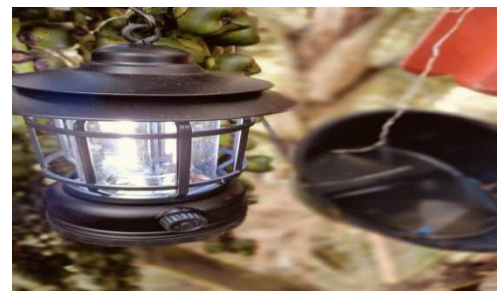
Gambar 3. Perangkap Cahaya

Perangkap cahaya dirancang untuk menangkap serangga nocturnal yang aktif di malam hari. Sebanyak empat unit light trap dipasang secara diagonal mengelilingi pohon sampel di masing-masing lokasi. Jenis lampu yang digunakan adalah lampu kapal, yang dinyalakan setiap hari mulai pukul 18.00 WIB hingga 06.00 WIB. Serangga yang tertarik cahaya akan terperangkap di wadah perangkap yang telah disiapkan di bawah sumber cahaya. Pengamatan terhadap hasil tangkapan dilakukan setiap pagi hari selama tujuh hari berturut-turut (Degen, et al , 2009).