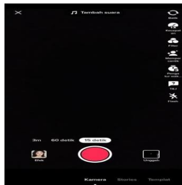
Gambar 2. Klik efek yang ada di sebelah kiri