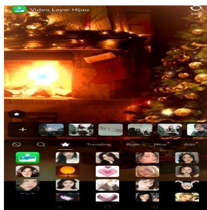
Gambar 5. Bisa memilih video yang akan dijadikan sebagai latar belakang

Berdasarkan hasil penelitian di atas, dapat diketahui bahwa siswa merasa malu ketika membacateks berita di depan kelas dan di hadapan teman-temannya, faktor tersebut menjadi faktor utama yang membuat siswa menjadi tidak percaya diri, sehingga terbata-bata dalam membaca teks berita, suara yang dikeluarkan tidak lantang, bahkan wajah pun bisa ditutupi oleh kertas agar tidak melihat teman-